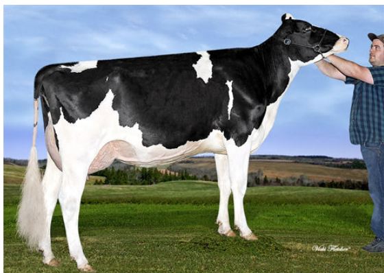
ROQUET NIKA DUTY FREE