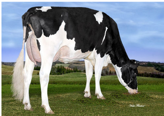
ROQUET NIKA DUTY FREE